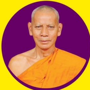
พระธรรมวิชชาจารย์ ผู้อำนวยการวิทยาลัยสงฆ์มหาสารคาม ประธานโครงการ