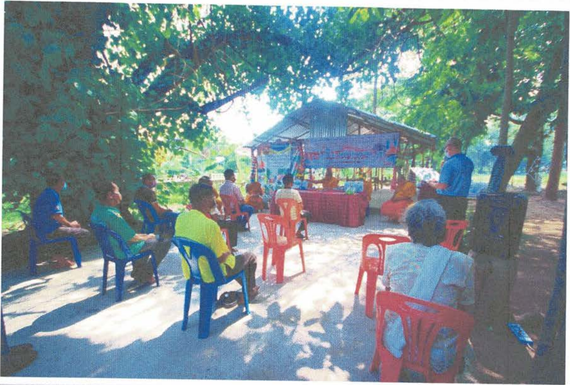
๗. ผู้นำหมู่บ้านถวายสักการะการต้อนรับ